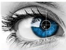
(Holmqvist u. a., 2011)

Schauen wir ein Video, betrachten ein Bild oder lesen einen Text, vollführen unsere Augen Bewegungen. Diese Blickbewegungen sind in vielen Wissenschaften von großem Interesse. Wir können unter Verwendung eines Eye-Trackers Daten über Blickbewegungen erheben und danach mit geeigneter Software analysieren. In diesem Beitrag widmen wir uns unter anderem den Fragen „Welche Bewegungen verüben unsere Augen beim Lesen?“, „Wie lassen sich Eye-Tracking-Daten geeignet darstellen?“, „Unterscheidet sich der Leseprozess eines Profis von dem eines Anfängers beim Lesen eines mathematischen Texts?“